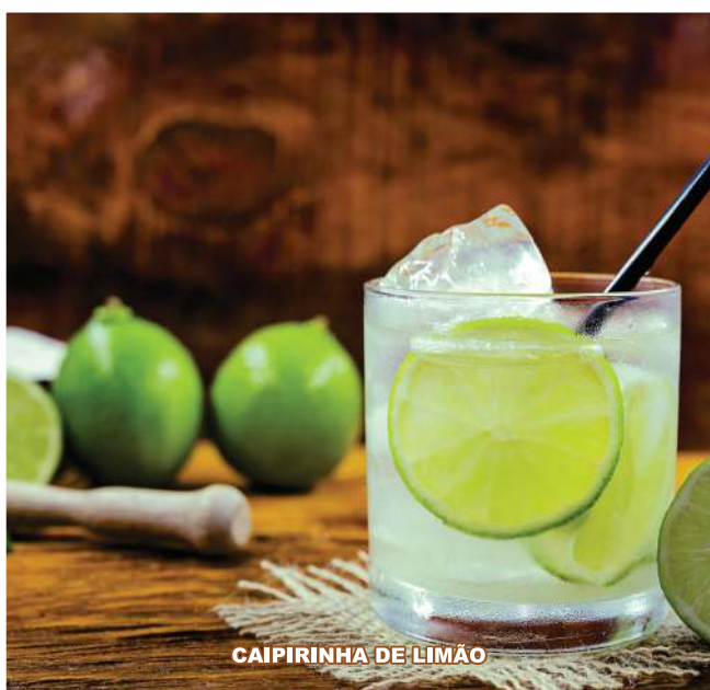
CAIPIRINHA DE LIMÃO