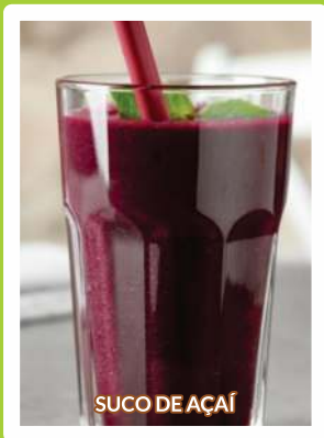
SUCO DE AÇAÍ