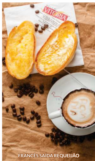
FRANCÊS SAÍDA REQUEIJÃO