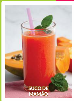
SUCO DE MAMÃO