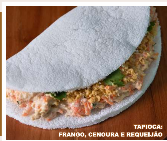
TAPIOCA: FRANGO, CENOURA E REQUEIJÃO