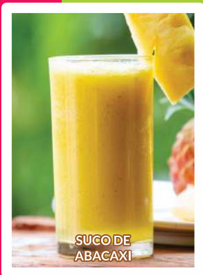
SUCO DE ABACAXI